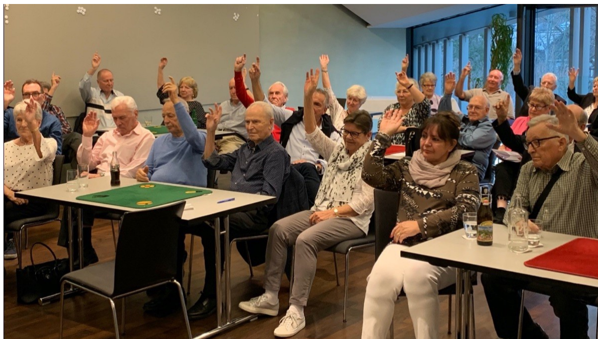
Die Wahl des Vorstands wurde einstimmig angenommen.